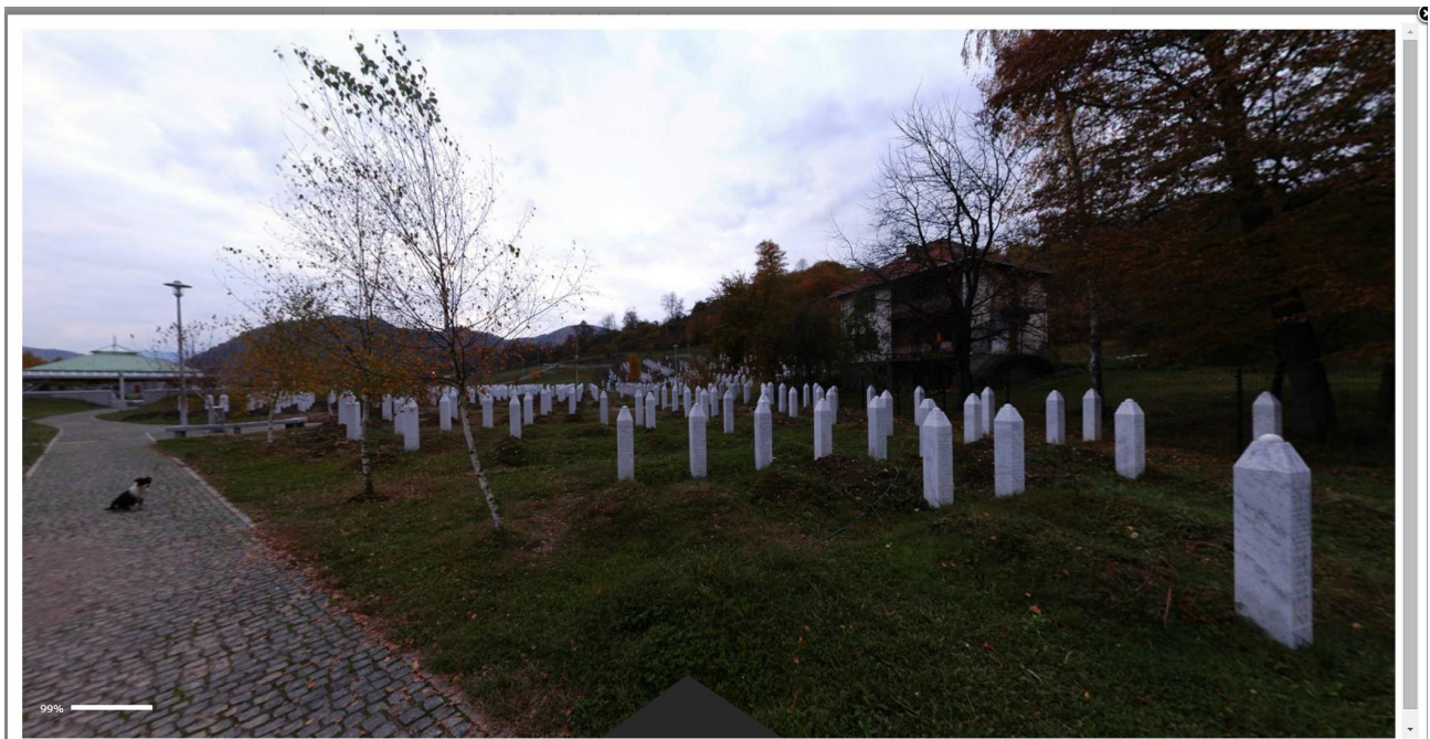
Tour virtuale del Memoriale di Srebrenica, Bosnia (selezionabile in http://www.ba.itc.cnr.it/bosnia.html )