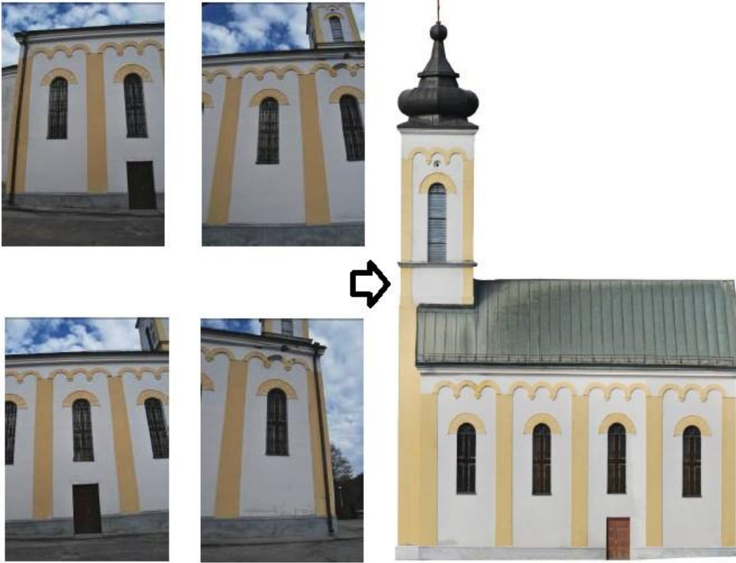
Dalle riprese fotografiche al fotopiano digitale della Chiesa Ortodossa "Pokrov Presvete Bogorodice"