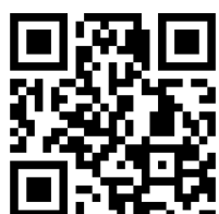
Tavola rotonda 1:

Partecipa alle tavole rotonde rispondendo al questionario